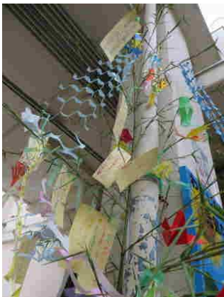
昇降口と玄関で涼しげに風に揺れている七夕飾り。