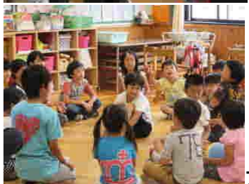
大きな輪になり「ごろごろドカン」