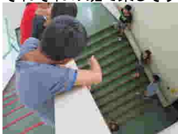
階段でゲーリーコ！