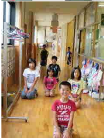
だーるーまーさーんーがー正座した！