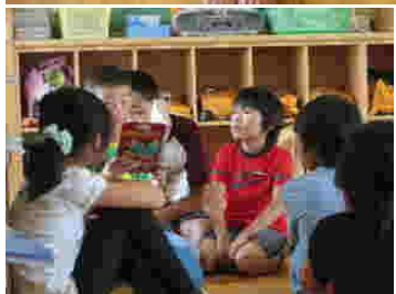
明かりを消して…怪談話