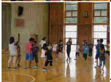
体育館ではドッジボールを楽しみました。