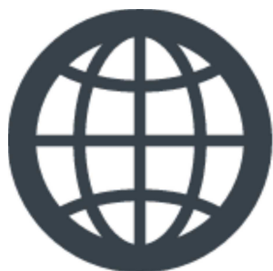
ネットワークマーク