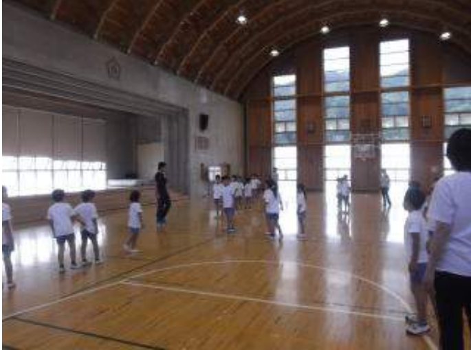
運動会の当日が楽しみです♪